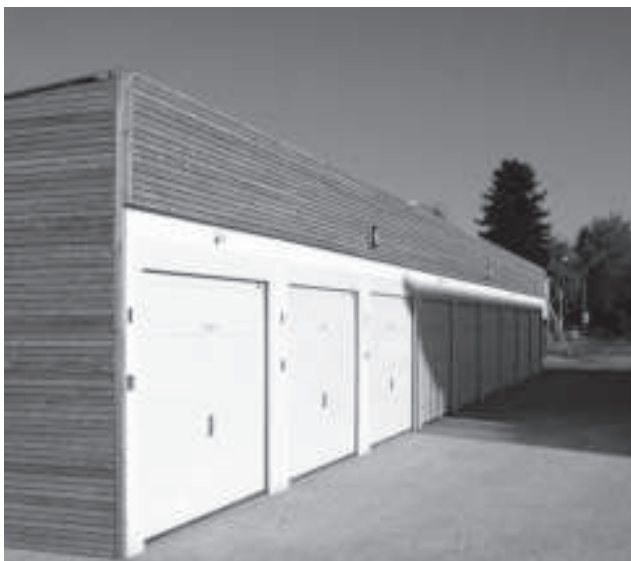
Das Seniorenzentrum in Bildern.

“Technik von morgen für unsere Kunden heute”.